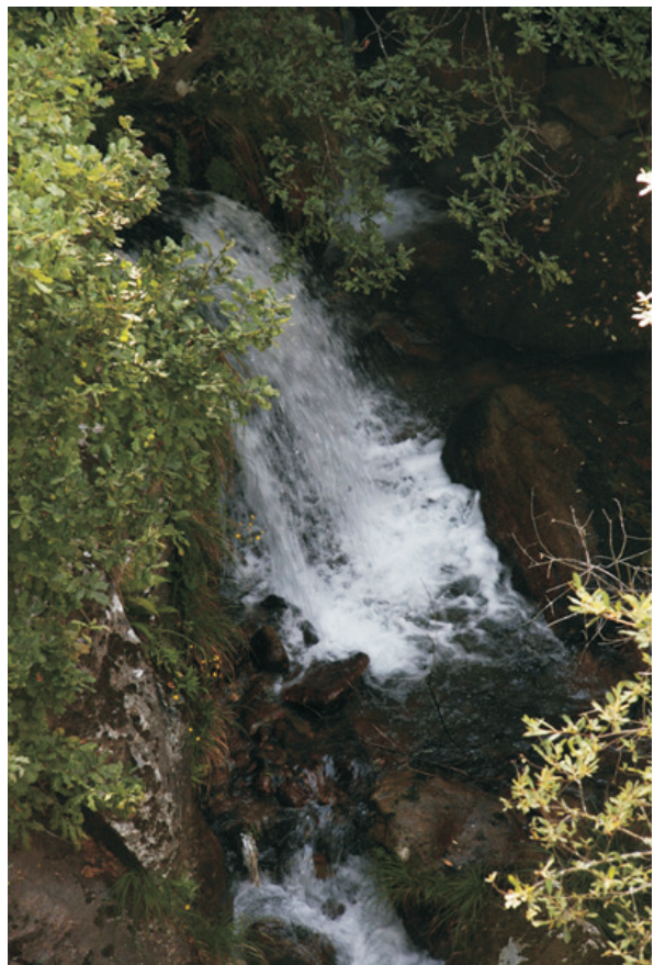
Rego de Ponte Pardellas