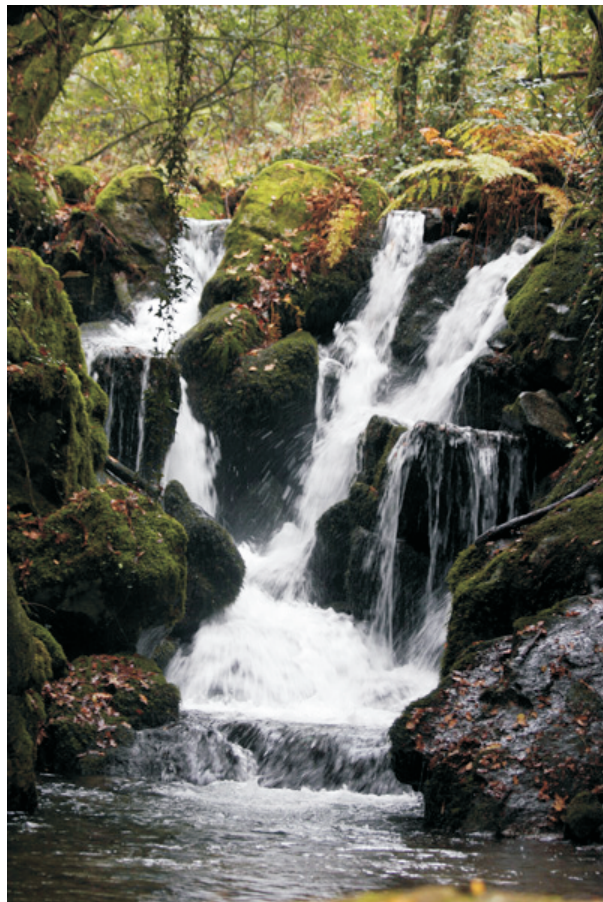
Regueiro de Coveliño

COMO CHEGAR: en Maceiras, na zona da área recreativa e detrás da minicentral. Pódense ver desde debaixo da ponte da estrada pero é moi complicado seguir o río por ir encaixado entre rochas.