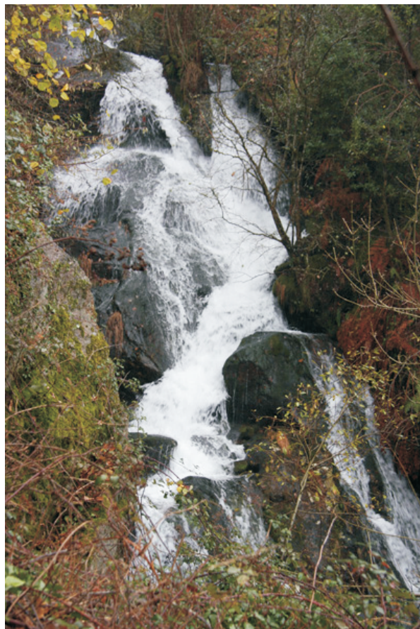
Rego de Ponte Piñeiro