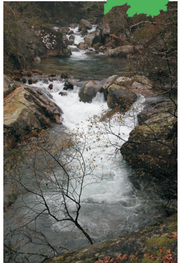
O Tea en Lourido

COMO CHEGAR: desde a estrada de Ponte Maceira a Prado cóllese o desvío de Loureiro. A ferveza atópase preto da estrada onde se cruza o río.